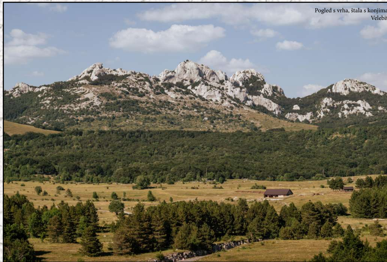
Pogled s vrha, štala s konjima Velebit