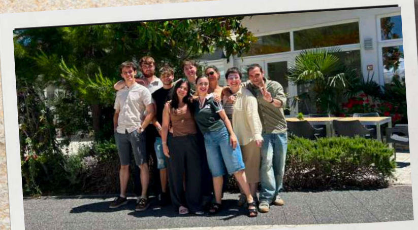
- The gang on the last day!! :((