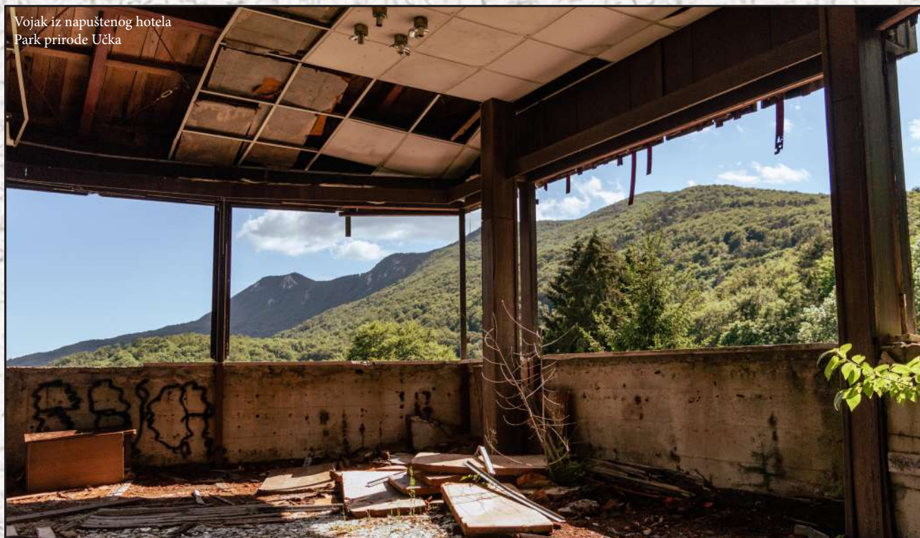
Vojak iz napuštenog hotela Park prirode Učka