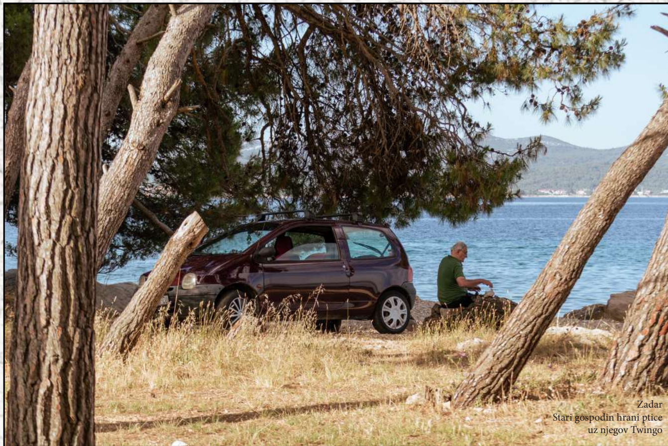
Zadar Stari gospodin hrani ptice uz njegov Twingo