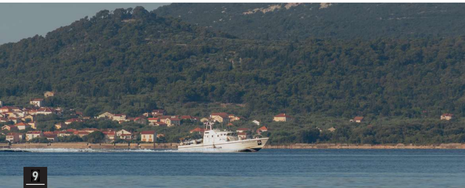
- The water was indeed SOOOO clear!!