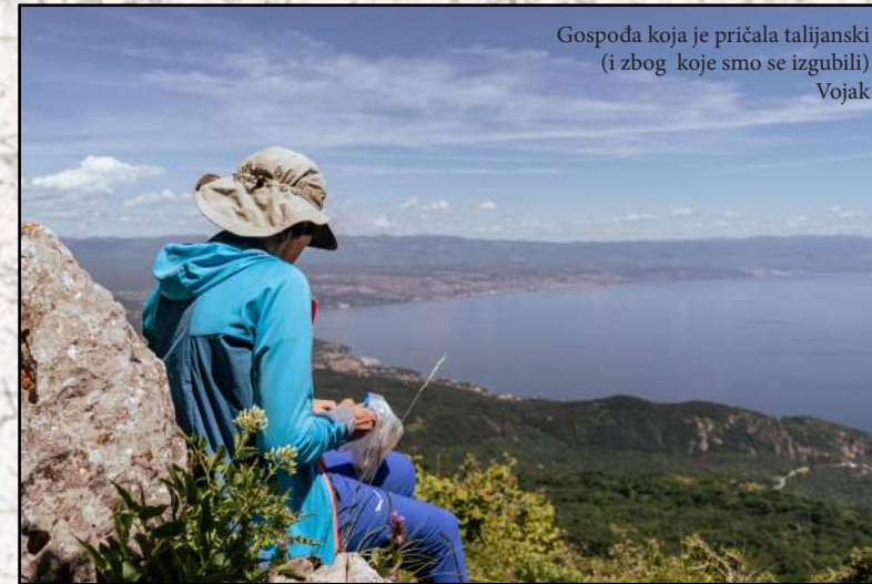
Gospoda koja je pričala talijanski (i zbog koje smo se izgubili) Vojak