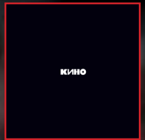
1.2 Kino - Лето