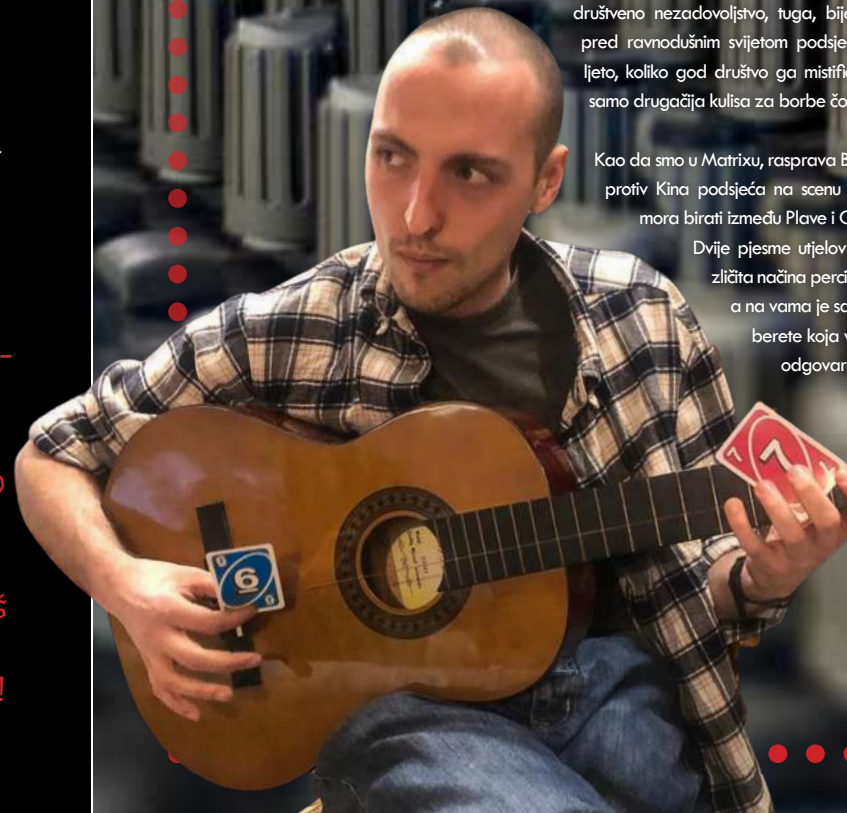
7. Preživi ljet i saznaj...