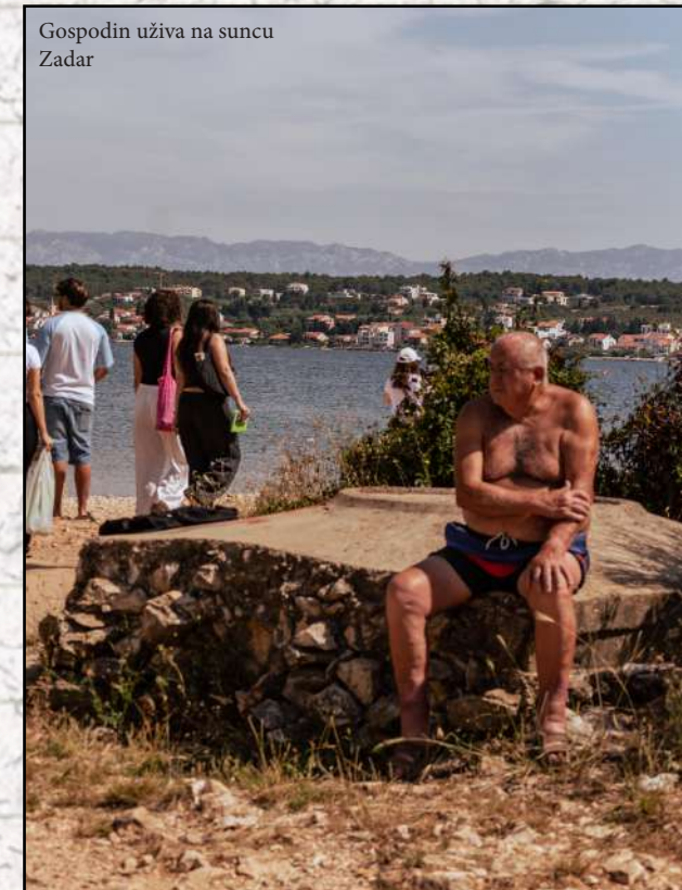
Gospodin uživa na suncu Zadar