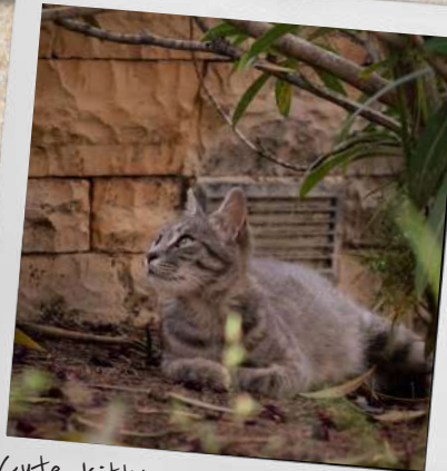
Cute Kitty cat we saw at the hostel!