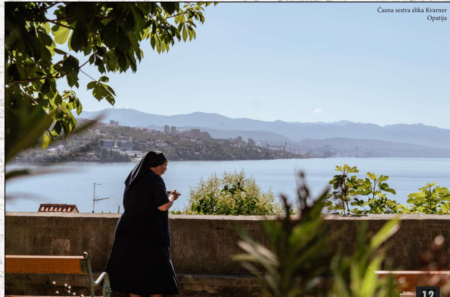
Časna sestra slika Kvarner Opatija