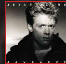
1.1 Bryan Adams - Summer of '69

Dvije pjesme utjelovljuju dva različita načina percipiranja ljeta, a na vama je samo da odaberete koja vam najbolje odgovara.