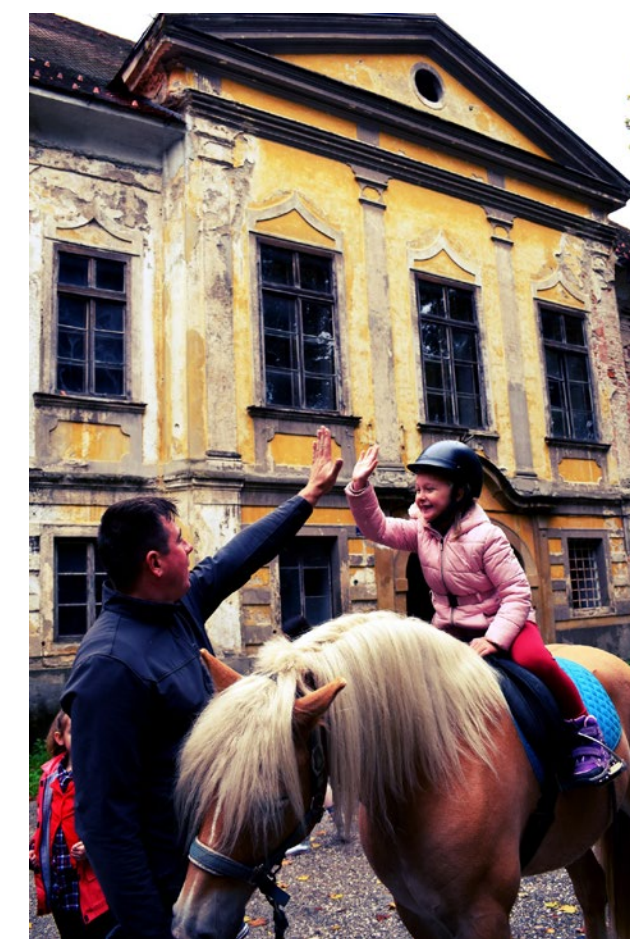
Volonterska akcija „Vrtić sreće“.