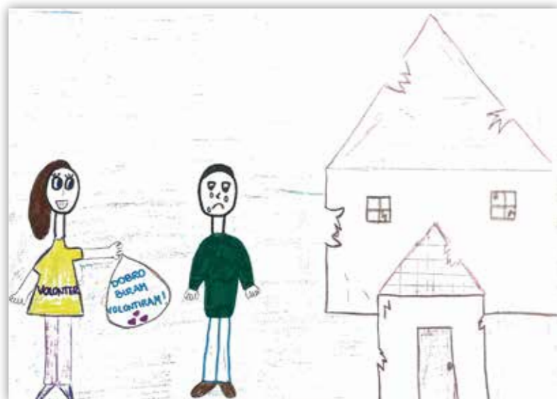
Matej Antolić, 7.a / Osnovna škola Đure Prejca Desinić