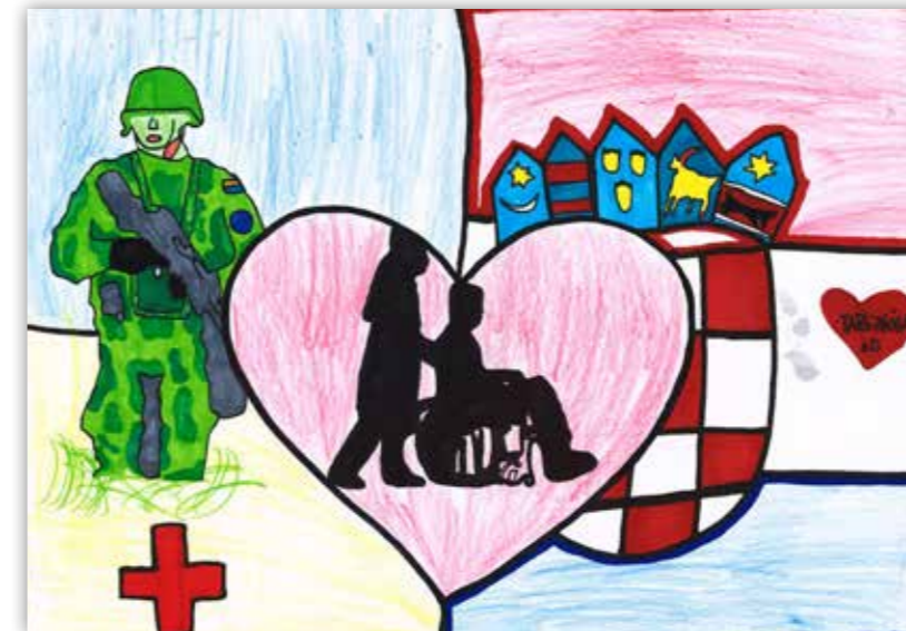
Tara Peček , 5.d / Osnovna škola Ksavera Šandora Gjalskog Zabok